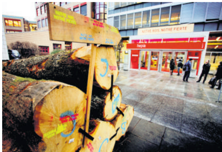
L'exposition «Notre bois, notre fierté» se tient jusqu'au 10 février.

Notre bois, notre fierté, c'est aussi l'intitulé d'une exposition qui se tient à l'Hepia (Haute école du paysage, de l'ingénierie et de l'architecture) jusqu'au 10 février, organisée par Lignum-Genève (communauté d'action régionale en faveur du bois). Timber Project, expo conçue par le laboratoire de la construction en bois de l'EPFL,